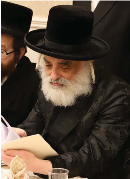
כ"ק אדמו"ר מוויזשניץ-ירושלים שליט"א מעיין ב"נועם שיח"