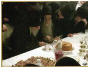
הגאון רבי ירוחם אולשין שליט"א מראה להרבי את התמונה