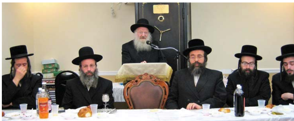
המשגיח זצ"ל במסיבה לישיבת "צמח צדיק" וויז'ניץ בארא פארק בביהמ"ד סאנטוב לייקווד - שנת תשס"ח

סיפר לי הגה"צ רבי מתתיהו סלומון זצ"ל, משגיח רוחני דשיבת לייקווד: כאשר המשגיח הקודם, הגה"צ רבי נתן ווכטפויגל זצ"ל, הגיע לימי הזקנה, ביקש ממני שאעקור את דירתי מגייטסהעד שבאנגליה - עיר מושבי דאז - ואקבע את דירתי בלייקווד שבארה"ב, כדי שאוכל לעמוד לימינו ולעזור לו בתפקיד ההשגחה, ולאחר מאה ועשרים שלו, אקח את התפקיד ממנו, להיות המשגיח בישיבה. כשהגעתי ללייקווד, שאלתי את רבי נתן "ילמדנו רבינו, מה צריך משגיח לעשות?" אמר לי רבי נתן שאבוא למחרת בשעה מסויימת לביתו, ושם ילמדני. למחר בשעה היעודה הגעתי לביתו של רבי נתן, וכעבור כמה רגעים נשמעה לפתע נקישה על הדלת, שם ניצבו אב ובנו בן השלש, שהגיעו אליו כדי שיגזוז משער הילד לרגל מלאת לו שלש שנים. רבי נתן לקח מספריים וגזז קצת משערות הילד, ובירך את האב ובנו, ופטרים לשלום. לאחר שפנו האורחים והלכו לדרכם, נפנה אלי רבי נתן ואמר לי "עכשיו ראית מה משגיח צריך לעשות???"