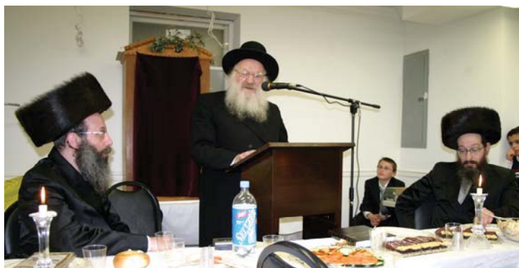
המשגיח זצ"ל במלכה מלכה הראשונה של קהילת סאנטוב מוצש"ק ויק"פ תשס"ו