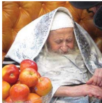
הרה"ק מטאהש זי"ע סוף ימיו